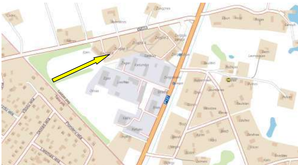
Dzirvokļa Nr.12, Talsu novadā, Laidzes pagastā, Zvirgzdos, „Zvirgzdi 6” piespiedu pārdošanas vērtības noteikšana